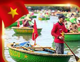
เรือกระด้ง หมู่บ้านกิมถาน