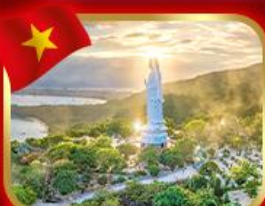
ขอพรกวอิม วัดหลินอึ้ง