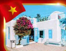
คาเฟ่สุดชิค ซานทรา มารีน่า