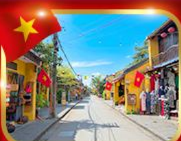
เมืองมรดกโลก ฮอยอัน