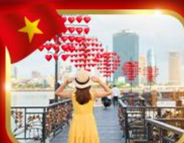
เช็กอินสะพานแห่งความรัก