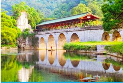
สวนเจ็ดดาว

หลังอาหารเช้าท่านเดินทางสู่ เมืองกุ้ยหลิน 桂林 เมืองท่องเที่ยวชื่อดังในมณฑลกว่างสี