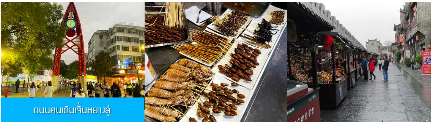
ถนนคนเดินเจิ้นหยางลู่