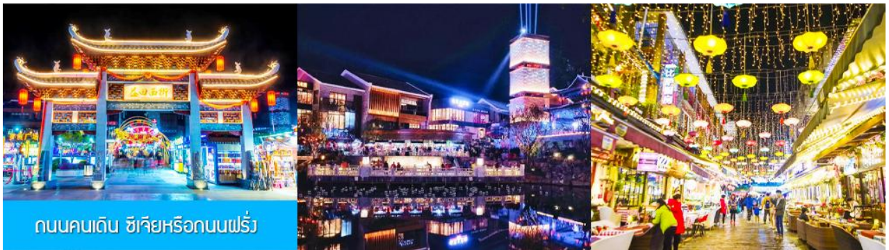
ถนนคนเดิน ซิเจียหรือถนนฝรั่ง