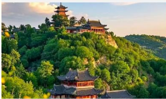
เขาเหยาหวังซาน