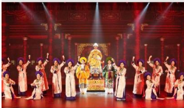
The Heritage Show