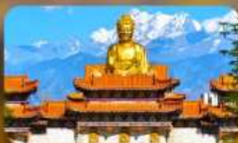
วัดพระใหญ่ทวงกงซาน