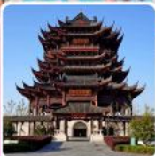
วัตดองหยวน