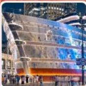
เรือหลุยส์