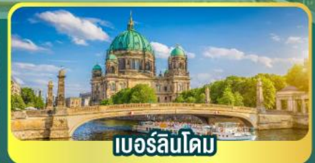
เบอร์ลินโดม