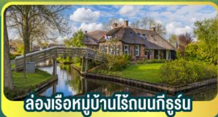
ล่องเรือหมู่บ้านไรน์บนทีกูร์น