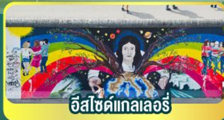
อีสไซด์แกลลอรี่