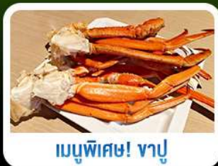
เมนูพิเศษ! ซาซิมิ