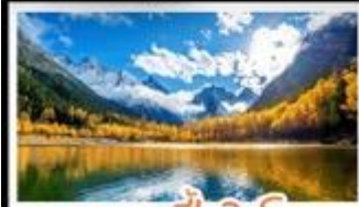
อุทยานป่าแดงโกว