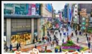
ซอปปิงกวมซุนซึ