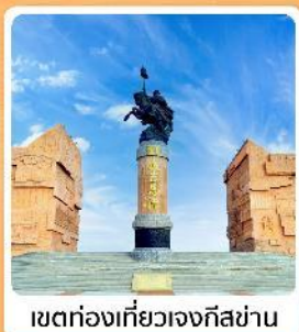
เขตท่องเที่ยวเจงกิสข่าน