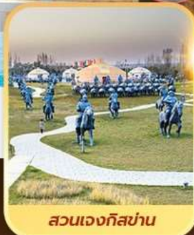
สวนเจงกิสข่าน