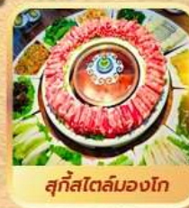
สุกีสไตล์มองโก