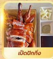
เปิดปาทัง