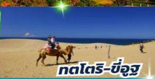
กตโตริ-ขี่อูฐ