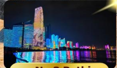
หาด No.3 Bathing

เมนูพิเศษ ซาบูสายพาน 6 วัน 4 คืน เดินทาง : พฤษภาคม 69