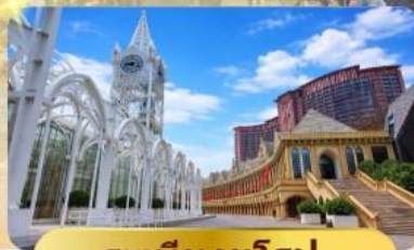
ระบียงยุโรป