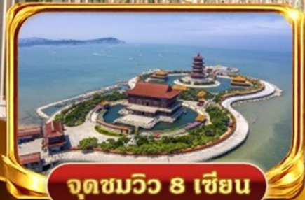
จุดชมวิวกว 8 เซียน