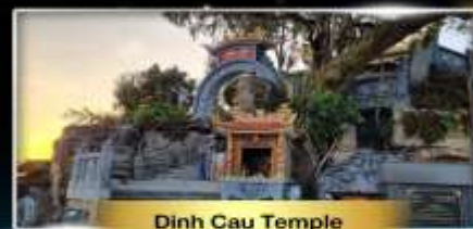
Dinh Cau Temple