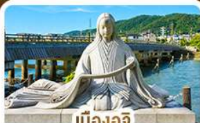
เมืองอิจิ สวรรค์คนรักชาเขียว