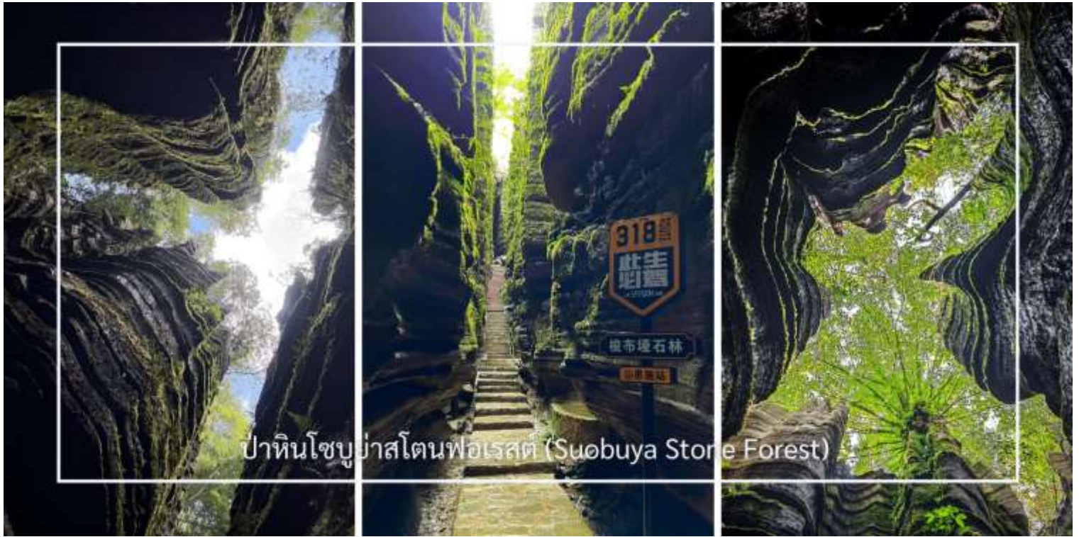
ป่าหินโซบูยา สโตนฟอเรสต์ (Suobuya Stone Forest)

สมควรแก่เวลานำท่านเดินทางกลับอู่ซาง (ใช้เวลาประมาณ3ชั่วโมง)