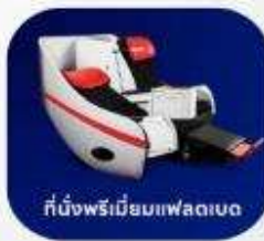
ที่นั่งพรีเมียมฟเลกซ์