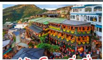
หมู่บ้านโบราณจีวเฟิน