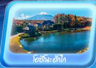
โอชิโนะอัทโท