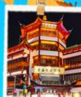
ตลาด 100 ปี