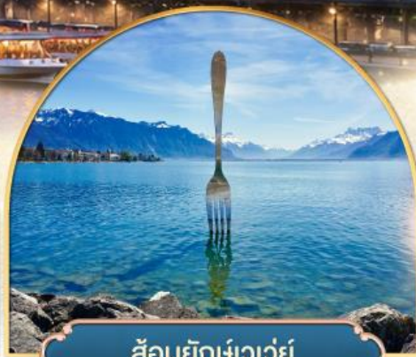
ส้อมยักเขาวัว