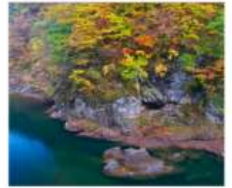
ซุนเขาดากิไคริ