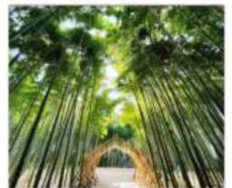
ป่าไฟวากายามะ