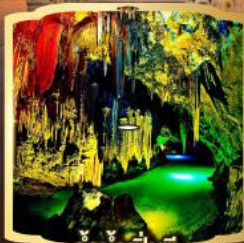
ถ้ำน้ำเป็นซี