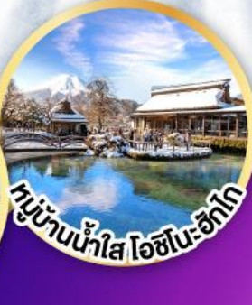
หมู่บ้านน้ำใส ไอชิโนะ-ซึกาโ