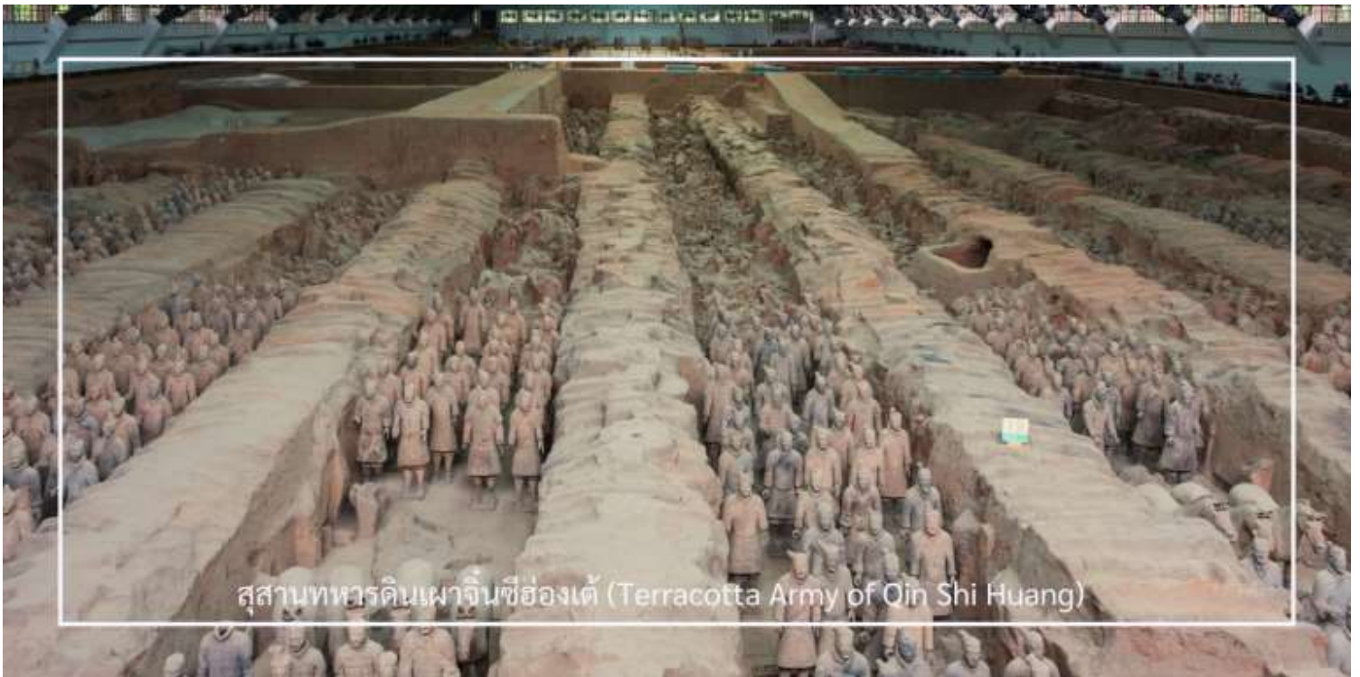
สุสานทหารดินเผาจิ๋นซีฮ่องเต้ (Terracotta Army of Qin Shi Huang)

หลังอาหารนำท่านเดินทางสู่ สุสานทหารดินเผาจิ๋นซีฮ่องเต้ (Terracotta Army of Qin Shi Huang) ใช้เวลาในการเดินทางประมาณ 1 ชั่วโมง ที่นี่คือหนึ่งในสิ่งมหัศจรรย์ของโลกยุคโบราณและแหล่งโบราณคดีที่สำคัญที่สุดของจีน ตั้งอยู่ใกล้เมืองซีอาน มณฑลส่านซี ค้นพบโดยบังเอิญในปี ค.ศ. 1974 ก่อนจะได้รับการขึ้นทะเบียนเป็นมรดกโลกโดยยูเนสโกในปี ค.ศ. 1987 ภายในเป็นสุสานของ “จิ๋นซีฮ่องเต้” จักรพรรดิองค์แรกของจีนผู้รวบรวมแผ่นดินเป็นหนึ่งเดียวในยุคราชวงศ์