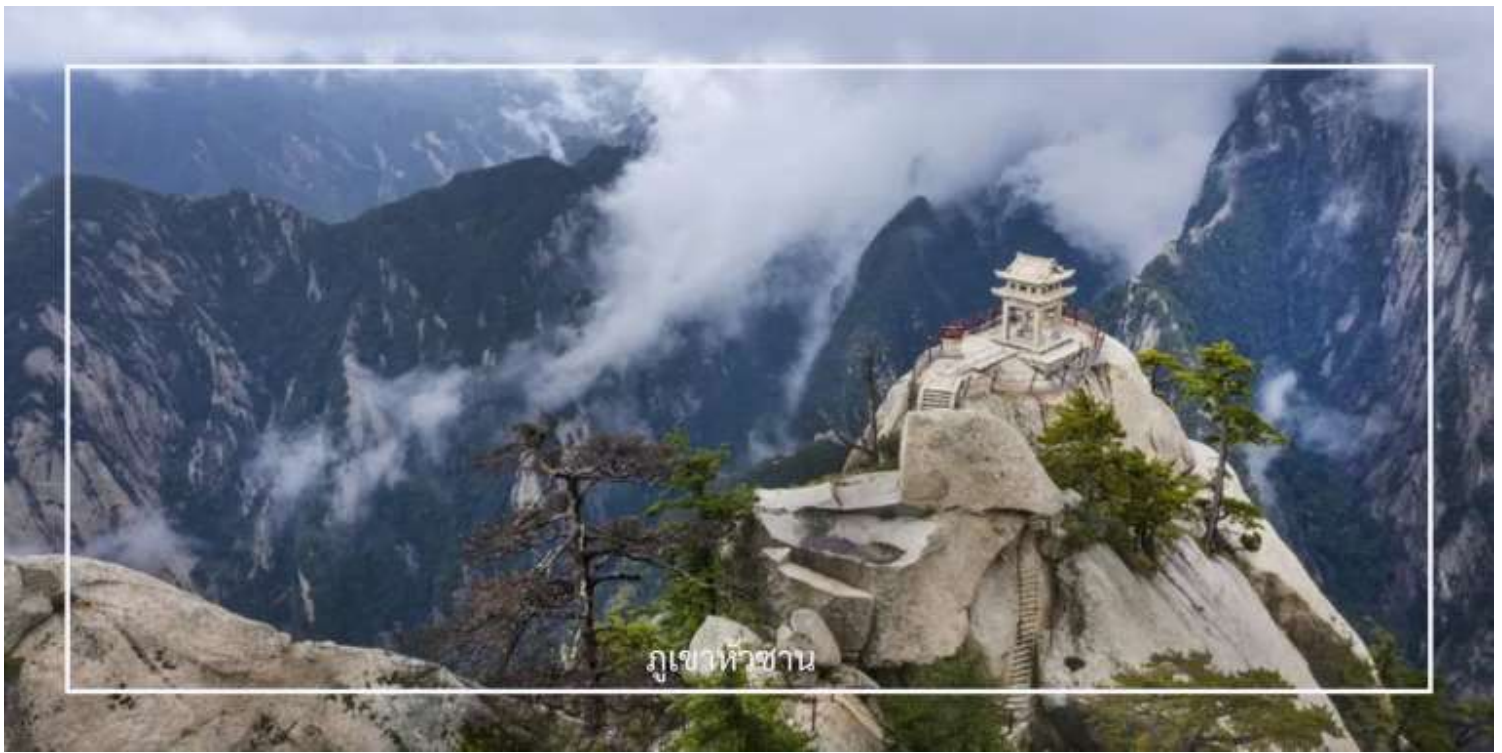
ภูเขาห้าซัน