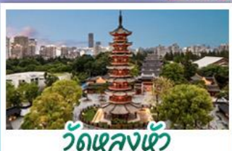
วัดเลงเซ้ง