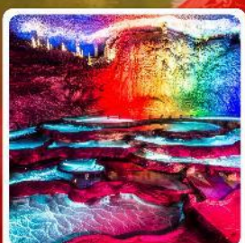
ถ้ำเก้าเทพ

ไฮไลท์! หมู่บ้านชาวน้ำเสียวเหอจินเจีย หมู่บ้านโบราณฟูหรงเจิ้น ถ้ำเก้าเทพ ล่องเรือทะเลสาบผิงหู สวนถ้ำสามสหาย