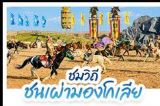
ชมวิถี ชนเผ่ามองโกเลีย

เปิดประสบการณ์ พักแรมมองโกเลียสุดพรีเมียมกลางทุ่งหญ้า สัมผัสบรรยากาศพระอาทิตย์ขึ้นสุดโรแมนติก ชมวิถีชนเผ่ามองโกเลีย พร้อมปาร์ตี้กองไฟใต้ท้องฟ้าเต็มไปด้วยความ • ตะลุยทะเลทรายอินคินทาลา ทำรูปสุดปังกลางทะเลทรายสีทอง • เที่ยวครบทั้งทุ่งหญ้าแอร์ดอส วัฒนธรรมมองโกเลีย และเมืองสุดโมเดิร์นในกรีปเดียว แบบสวยหรู ดูแพงทุกวัน