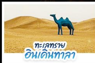
ทะเลทราย อินคินทาลา