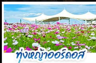
ทุ่งหญ้าแอร์ดอส