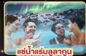
แช่น้ำแร่บลูลากุน