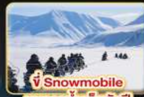
🏠 Snowmobile บนธารน้ำแข็งพันปี