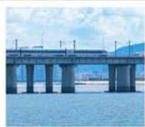
นั่งรถไฟใต้ดินข้ามทะเล