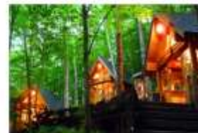
รับประทานอาหารค่ำ ภายในโรงแรม