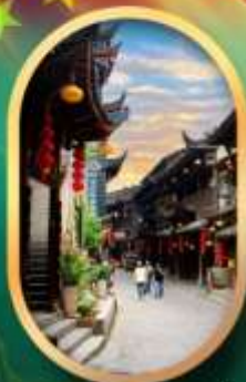
เมืองโบราณฟูหยงเจิน