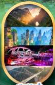
ฟรีคีย์เลือกซื้อ Option เสริม