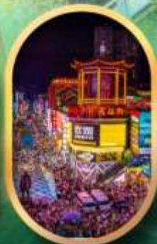
ถนนคนเดินซิงสู