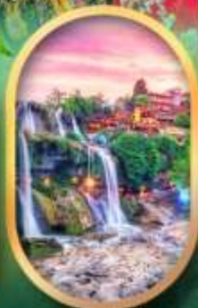
ฟูหลงเจินน้ำตก