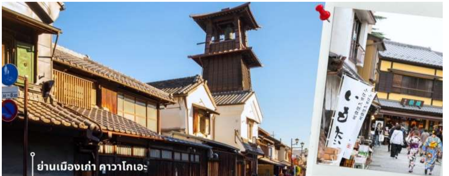
ย่านเมืองเก่า คาวาโกเอะ