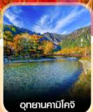
อุทยานคามิโคจิ