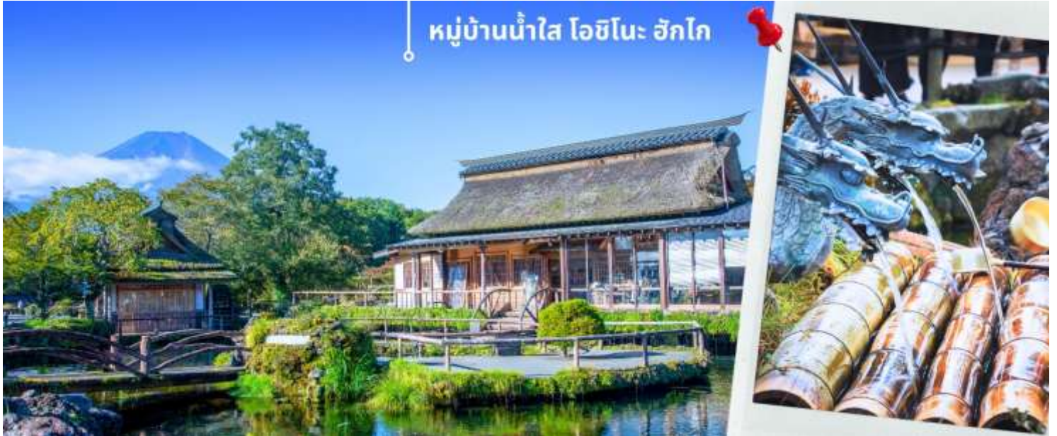
หมู่บ้านน้ำใส โอชิโนะ ฮักไก

หลังจากนั้น นำท่านเดินทางสู่ หมู่บ้านน้ำใส โอชิโนะ ฮักไก (Oshino hakkai) ถือเป็นหมู่บ้านแห่งการท่องเที่ยวที่ยังคงความอุดมสมบูรณ์ของธรรมชาติเอาไว้ได้อย่างดีในหมู่บ้านมีบ่อน้ำใสที่เป็นน้ำที่ละลายมาจากหิมะบนภูเขาไฟฟูจิ ที่นี่มีความสวยงามในระดับที่ว่าได้รับการขึ้นทะเบียนให้เป็นมรดกทางธรรมชาติ ในปี ค.ศ. 1934 และได้รับคัดเลือกให้เป็นหนึ่งในภูมิทัศน์ทางน้ำที่งดงามในปีค.ศ. 1985 อีกด้วย ทั้งยังเป็นอีกหนึ่งสถานที่ที่เราสามารถมองเห็นวิวฟูจิ หากวันนั้นเป็นวันที่ฟ้าเปิด