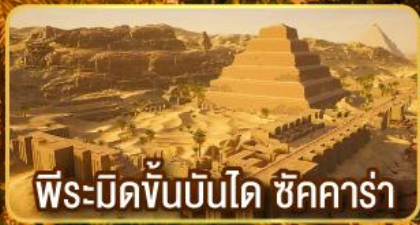
พีระมิดขั้นบันได ชิคคาร์่า