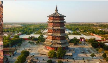
วัดเจดีย์ไม้ มู่ต้า

*ทางบริษัทฯ ขอสงวนสิทธิ์ในการสลับโปรแกรมทัวร์ตามความเหมาะสมขึ้นอยู่กับสถานการณ์หน้างาน โดยคำนึงถึงผลประโยชน์ของลูกค้าเป็นสำคัญ