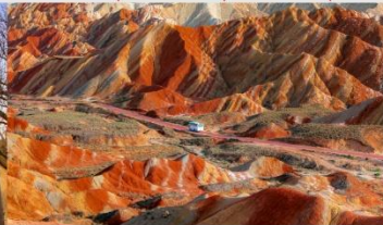
ภูเขาสายรุ้งจางเย่ต้นเสี่ย