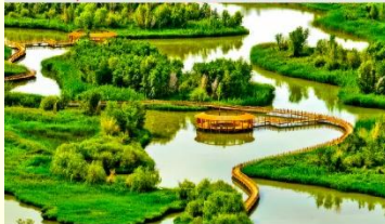
อุทยานพื้นที่ชุ่มน้ำจางเย่