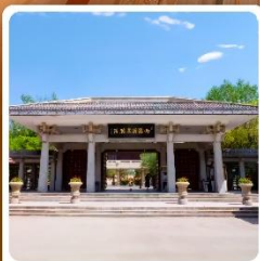
อุทยานประวัติศาสตร์จิวจวน