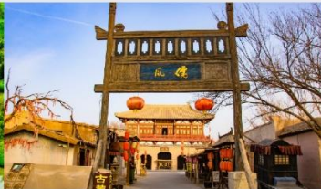
เมืองโบราณตุนหวง