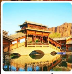
เมืองเล็กตันเสี่ยโซ่ว