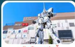
ห้างไดเวอร์ซิตี