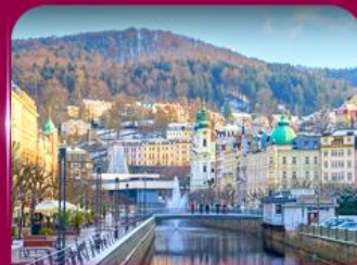
เมืองสปาแสนสวย คาร์โลวี วารี