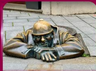
เซลฟี่คูคูมิล ปรากติสลาวา