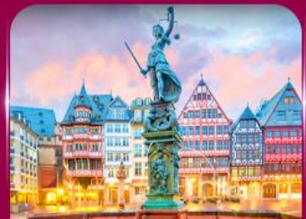
จัตุรัสโรเมอร์ แพรงก์เฟิร์ต