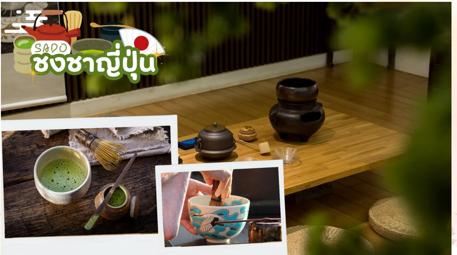
SADO ชงชาญี่ปุ่น

สัมผัสวัฒนธรรมดั้งเดิมของชาวญี่ปุ่น นั่นก็คือ กิจกรรมการชงชาญี่ปุ่น (Sado) โดยการชงชาตามแบบญี่ปุ่นนั้น มีขั้นตอนมากมาย เริ่มตั้งแต่การชงชา การจับถ้วยชา และการดื่มชา ทุกขั้นตอนนั้นล้วนมีขั้นตอนที่มีรายละเอียดที่ประณีตและสวยงามเป็นอย่างมาก และท่านยังมีโอกาสได้ลองชงชาด้วยตัวท่านเองอีกด้วย ซึ่งก่อนกลับให้ท่านอิสระเลือกซื้อของที่ฝากของที่ระลึกตามอัธยาศัย