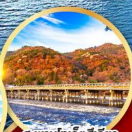
สะพานโทเก็ตสึเคียว