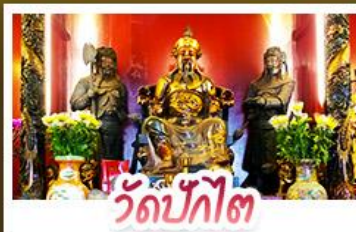
วัดปักไต่