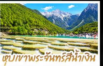
เขื่อนเขาพระจันทร์สีน้ำเงิน