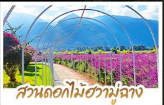
สวนดอกไม้ฮาม่ามู่ฉาง