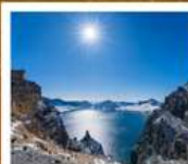
อุทยานดางไป่ซาน