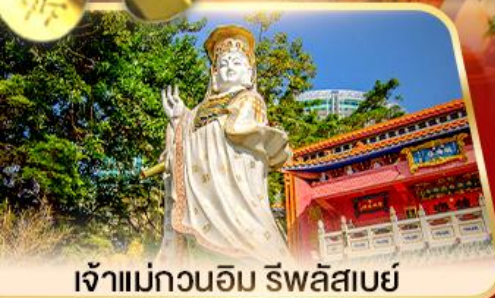
เจ้าแม่กวนอิม ธิพลัสเบย์