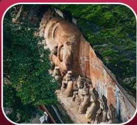
"ผาหินแกะสลักต้าจู้"