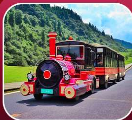
"อุทยานเขานางฟ้า"