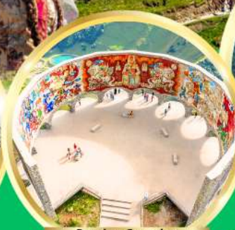
Russian-Georgian Friendship Monument