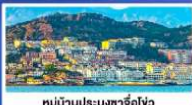
หมู่บ้านประมงซาโจ้ว