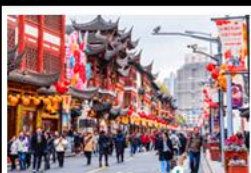
เฉิงหวิงเมี่ยว