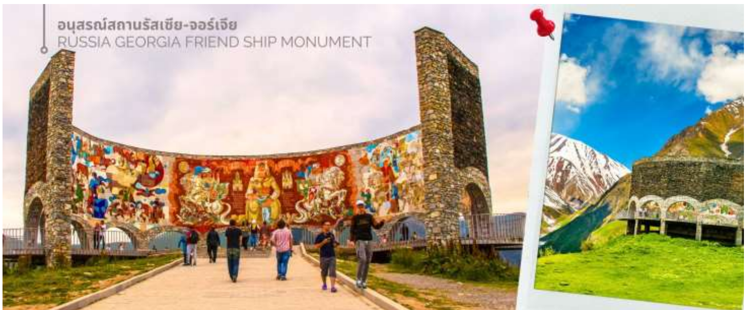
อนุสรณ์สถานรัสเซีย-จอร์เจีย RUSSIA GEORGIA FRIEND SHIP MONUMENT

จากนั้นนำท่านแวะถ่ายภาพและชมความงามของ อนุสรณ์สถานรัสเซีย-จอร์เจีย (RUSSIA GEORGIA FRIEND SHIP MONUMENT) เป็นอนุสรณ์หินคอนกรีตทรงกลมขนาดใหญ่ สร้างขึ้นในปี ค.ศ. 1983 เพื่อเฉลิมฉลองครบรอบ 200 ปีของสนธิสัญญาจอร์จีฟสกี (Treaty of Georgie ski) ซึ่งเป็นการแสดงถึงความสัมพันธ์อันดีระหว่างรัสเซียและจอร์เจียในช่วงเวลานั้น อนุสรณ์สถานนี้มี ความสูงประมาณ 20 เมตร และถูกออกแบบในสไตล์สถาปัตยกรรมโซเวียต ตัวอาคารมีรูปทรงกลมขนาดใหญ่ ภายในตกแต่งด้วยกระเบื้องโมเสกสีสันสดใส ซึ่งบอกเล่าเรื่องราวประวัติศาสตร์และวัฒนธรรมของทั้งสองชาติ ตั้งอยู่บนเส้นทางระหว่างเมืองกูตาอูรีและคาซเบกิ และทำเลบนยอดเขาสูง ทำให้เป็นจุดชมวิวที่สามารถมองเห็นทิวทัศน์อันงดงามของเทือกเขาคอเคซัสได้ ปัจจุบัน อนุสรณ์สถานแห่งนี้ยังคงตั้งอยู่ แต่ความหมายของมันได้เปลี่ยนแปลงไปอย่างสิ้นเชิง หลังจากการล่มสลายของสหภาพโซเวียต โดยเฉพาะอย่างยิ่งสงครามรัสเซีย-จอร์เจียในปี ค.ศ.2008 ทำให้ความสัมพันธ์ระหว่างสองประเทศตึงเครียดขึ้นอย่างมาก และส่งผลกระทบต่อความหมายของอนุสรณ์สถานแห่งนี้