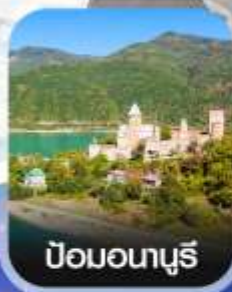
ป้อมอนานูรี