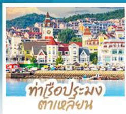
ทำเรือประมง ตาเหลียน