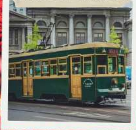
หาดหญ้าแดงผานจั้น